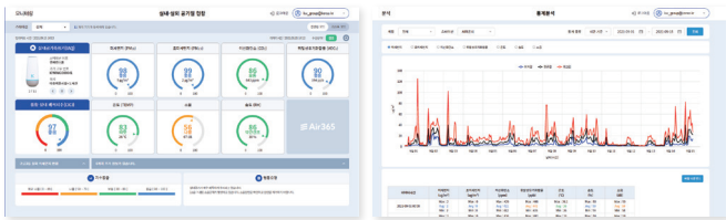
실내 외 공기질 현황